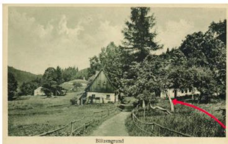
Lata 1920–1930