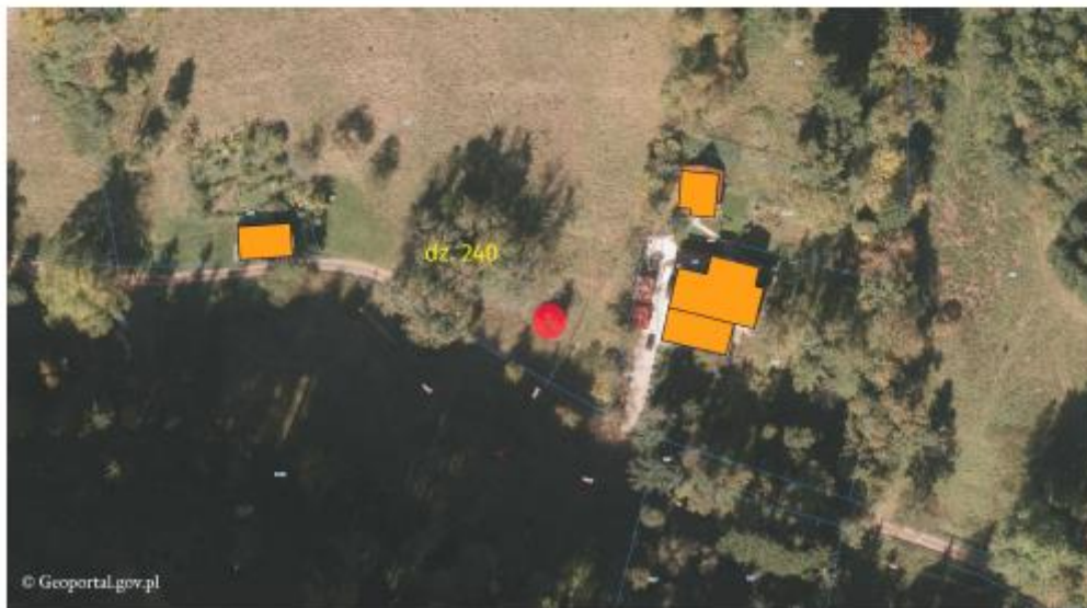
Lokalizacja drzewa na zdjęciu lotniczym